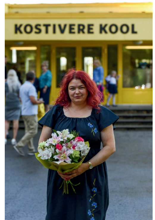
Foto on tehtud selle õppeaasta esimesel koolipäeval.